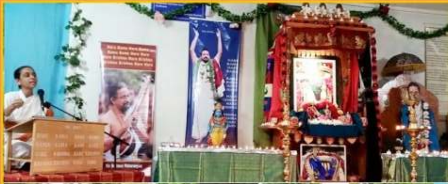
ஏப்ரல் - மே - அறிமரிக்காவில் தேசசங்கங்கள், பூர்ணிமரஜி