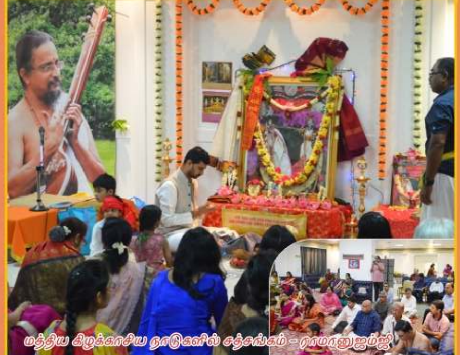
மத்திய திரக்காசிய நாடுகளில் தேசசங்கம் - ராமராஜமஜி