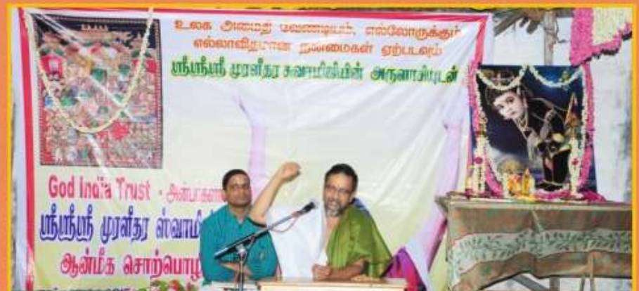
ஏப்ரல் 29 வாலராஜாபேட்டை பெருமாள் கோவிலில் மவராமந்திர கூட்டு பிரார்த்தனை