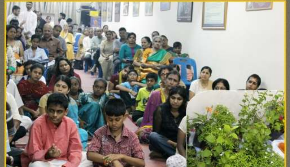
நேபாளத்தில் அண்மையில் ஏற்பட்ட பூசுமப்பத்தில் உயிர் நீத்தோருக்காக மலேசிய நாமத்வாரில் மே 9 அன்று ப்ரார்த்தனை, அஞ்சலி