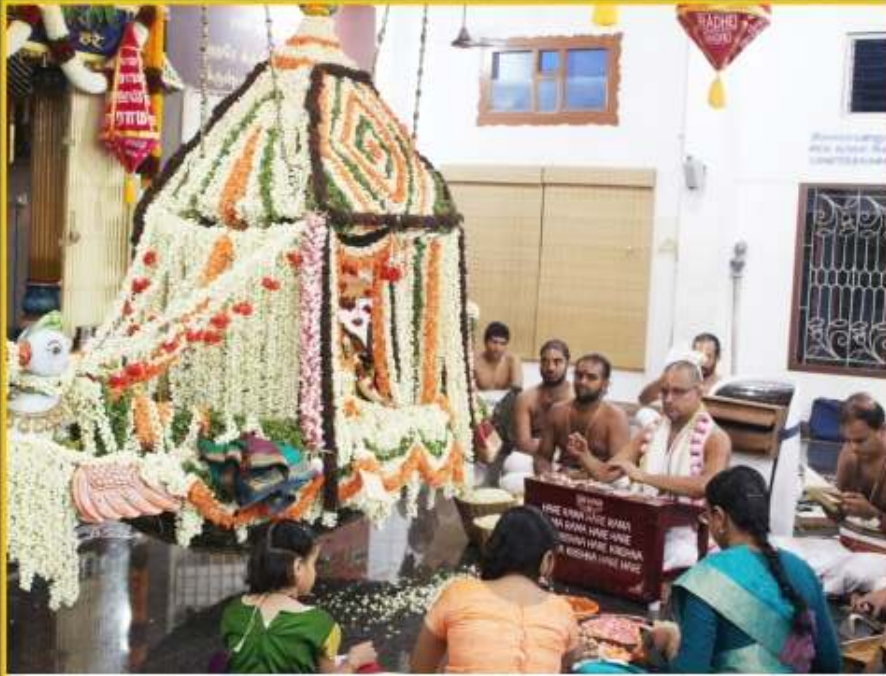
மே 8 - 17 - மதுரபுரி ஆஸ்ரமத்தில் வசந்தோத்ஸவம்